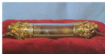
Relikwie van het H. Bloed te Brugge